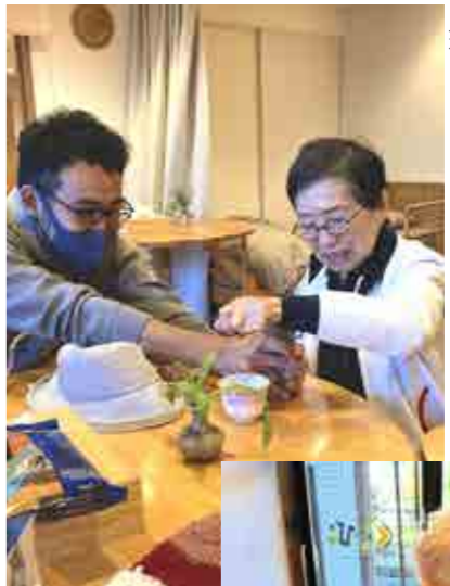
珈琲豆から挽いて...