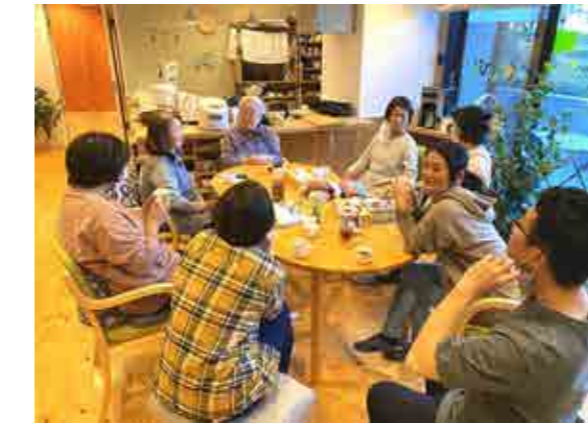
みんなでコーヒー片手にお話し TIME ♪