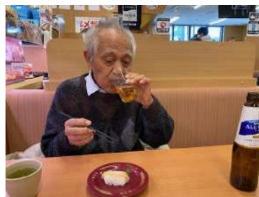
↑ ランチで一杯「うまいなあ」