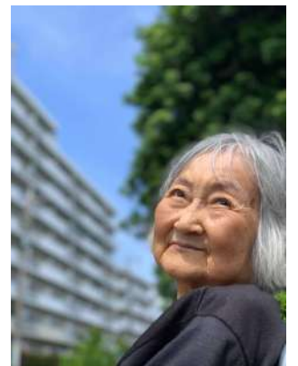
二番橋公演をお散歩→

誰しものがそうであるように、今この時は“今”しかありません。日々の生活の中で、季節を感じたり、ちょっとした楽しみを見つけながら、“今この瞬間”を大切にしながら暮らしています。